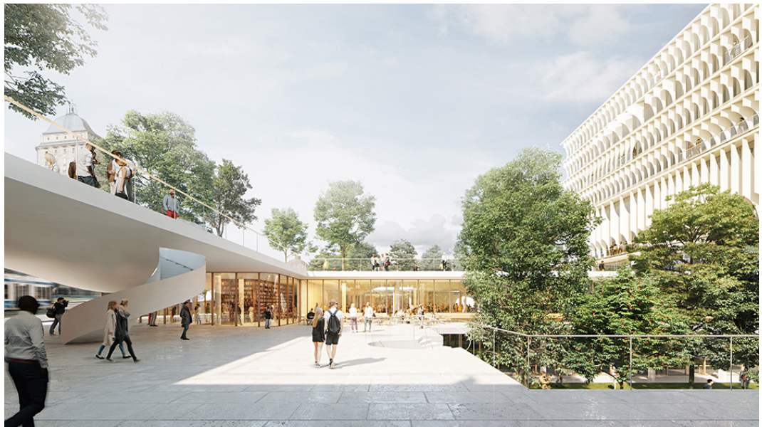
Forum UZH, Zugang von der Rämistrasse zu den öffentlich zugänglichen Turnhallen, Sporträumlichkeiten, Läden und Cafés (Visualisierungen: Herzog & de Meuron)

Auch die Planung für das Bildungs- und Forschungszentrum FORUM UZH schreitet in grossen Schritten voran, denn auch dieses Bauvorhaben soll per 2028 realisiert und bezogen sein. Dank dem Neubau FORUM UZH wird die UZH zahlreiche Einzelliegenschaften freigeben, die aufgrund ihres Innenausbaus für die moderne Forschung und Lehre ungeeignet sind und besser als Wohnraum genutzt werden. Diese Forderung zur Rückführung von durch die UZH belegten Liegenschaften in den umliegenden Quartieren als Kompensation des Neubaus war und ist eine der zentralen Forderungen der Quartiervereine, insbesondere des Quartiervereins Fluntern. Die UZH und die Stadt Zürich haben zwischenzeitlich einen Vertrag abgeschlossen, in welchem diese Rückführungen konkret in Flächen und Zeithorizonten festgelegt sind.