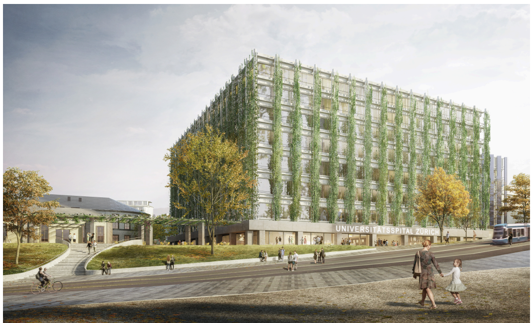
Neubau Campus MITTE1 und Alte Anatomie an der Gloriosastrasse. (© Christ & Gantenbein; Visualisierung: Atelier Brunecky)

Das Erscheinungsbild des Campus MITTE1 hat sich in der vergangenen Planungsphase stark weiterentwickelt. So wird neu das südliche der beiden Gebäude rundum von Pflanzen umrankt. Die Begrünung soll ein Beitrag zur Regulierung des stetig wärmer werdenden Stadtklimas, aber auch zum Wohlbefinden der Patientinnen und Patienten sowie der Mitarbeitenden beitragen. Auf dem Dach und den dafür geeigneten Fassaden des zweiten, nördlichen Gebäudes werden Photovoltaik-Elemente angebracht. Sie leisten einen Beitrag zur nachhaltigen und CO 2 -armen Energieversorgung des gesamten USZ.