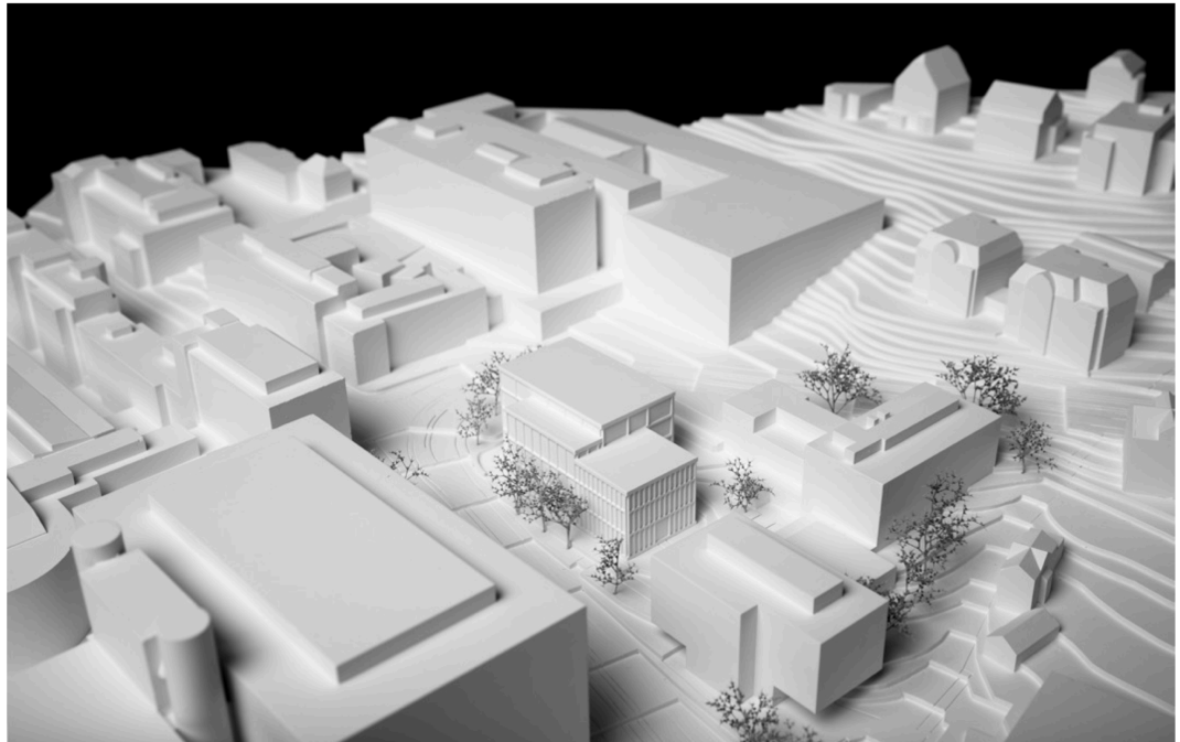
Modellfoto des Provisoriums der Sporthallen im Gloriarank

angelegt, was eine effiziente Konstruktionsweise ermöglicht. Indem auf eine betonierte Bodenplatte verzichtet wird und ausschliesslich vorgefertigte Bauteile eingesetzt werden, kann das Projekt nachhaltig erstellt und später auch wieder rückgebaut werden.