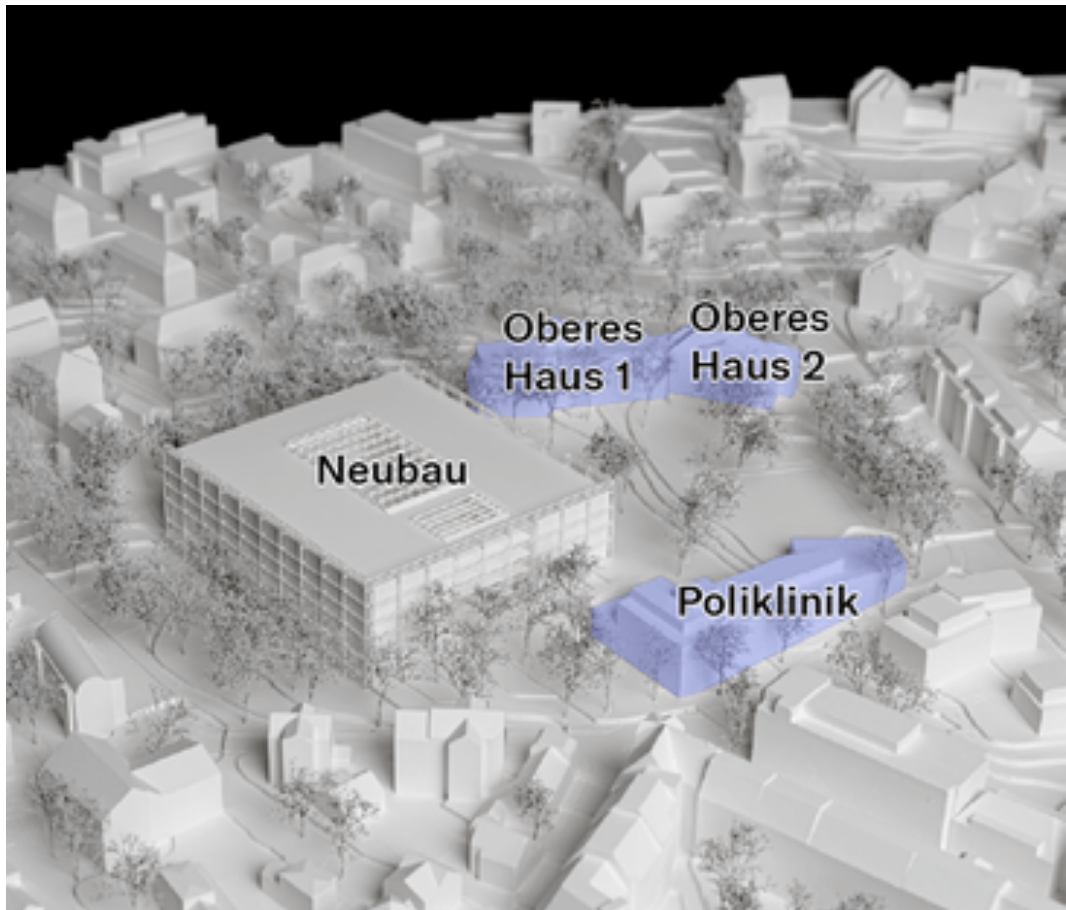
Zentrum für Zahnmedizin, Projektwettbewerb, 1. Preis Visualisierung: ARGE Boltshauser Architekten AG / Drees & Sommer aus Zürich

Die Baueingabe für den Neubau des ZZM ist auf 2023 und der Bezug auf 2029 geplant. Das heutige Kinderspital wird voraussichtlich im Sommer 2022 in den Neubau auf der Lengg ziehen.