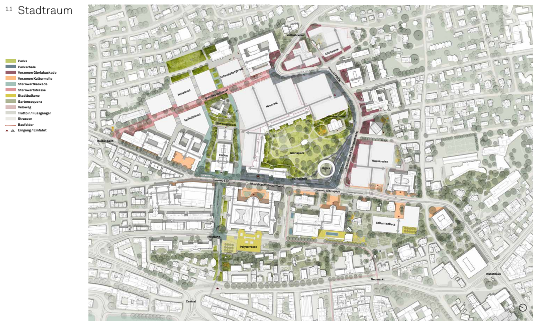
Übersichtsplan zu den «Prinzipien Stadtraum» aus dem Weissbuch des HGZZ