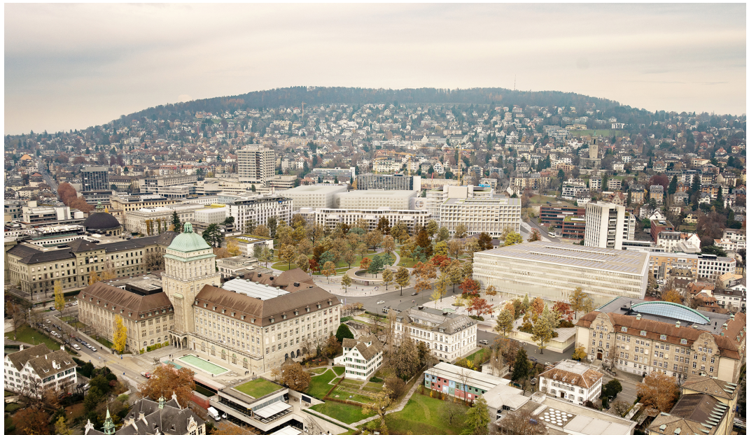
Pavillon im Spitalpark an der Ecke Rämistrasse – Gloriamstrasse

Im Herzen des zukünftigen Campus HGZZ liegt die «Parkschale», für welche derzeit ein Vorprojekt erarbeitet wird. In diesem Zusammenhang soll die Idee der «AGORA» als «Pavillon im Park» mit einem Gastronomieangebot in einem Projektwettbewerb weiter konkretisiert werden. Auch für dieses Verfahren sind die Resultate auf Anfang April 2021 angekündigt.