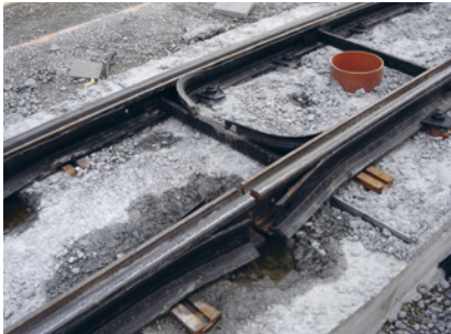
VBZ-Normgleiseinbau: Schienenprofil Ri 60N mit Phoenix- Streustromisolation. Elastische, kontinuierliche Schienenlagerung (maximale Einsenkung 1 mm).